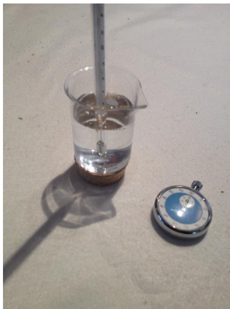
Εικ.1: Η πειραματική διάταξη – μικρό δοχείο

Τα μέρη της πειραματικής μας διάταξης φαίνονται στη φωτογραφία: