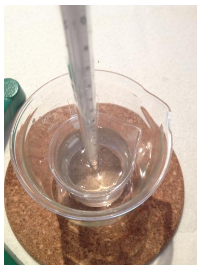
Εικ. 2: Πειραματική διάταξη με δύο δοχεία